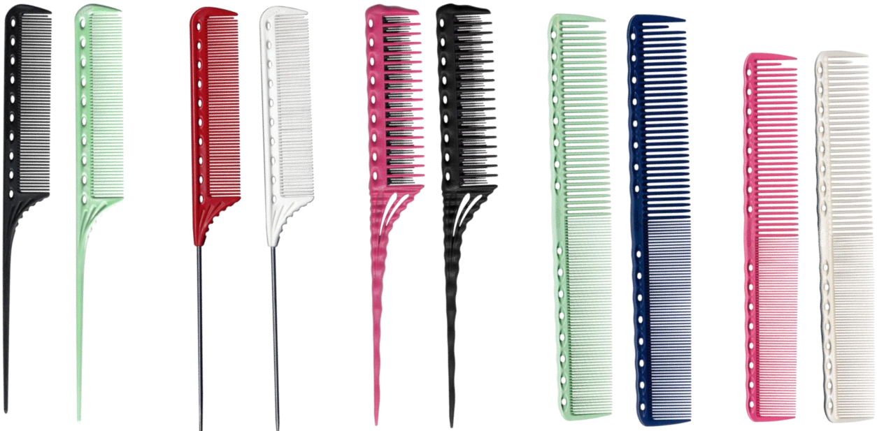
YS - 101 PUNKAM

Y.S. Park producten worden ontwikkeld vóór de stylist, dóór de stylist met de hoogste norm in kwaliteit . Kapperstools die gemakkelijk zijn in gebruik en waarmee snel, precies en uiterst efficiënt kan gewerkt worden om zo de meest prachtige haarcreaties te bekomen.